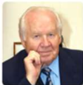
Савельев В.С. Президент ассоциации флебологов России