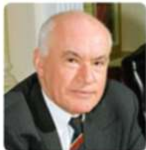
Бокерия Л.А. Президент ассоциации сердечно- сосудистых хирургов России